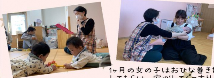
1ヶ月の女の子はおひな巻きしてもらい、安心してぐっすり